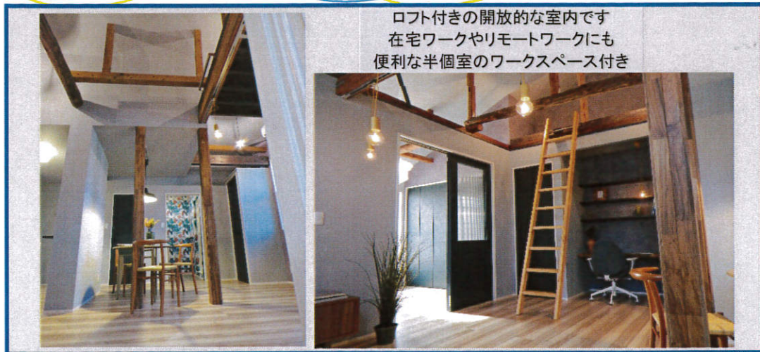
ロフト付きの開放的な室内です 在宅ワークやリモートワークにも 便利な半個室のワークスペース付き