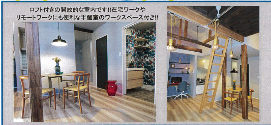
ロフト付きの開放的な室内です!!在宅ワークや リモートワークにも便利な半個室のワークスペース付き!!

閑静な住宅街 陽当り良好 吹抜 ロフト付き こだわりのデザイン デザイナーズ ハウス